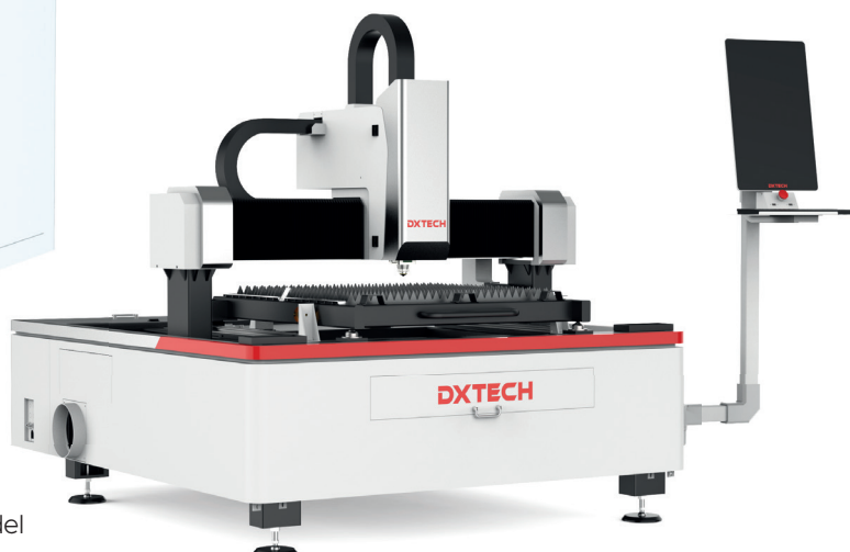
MQ - model